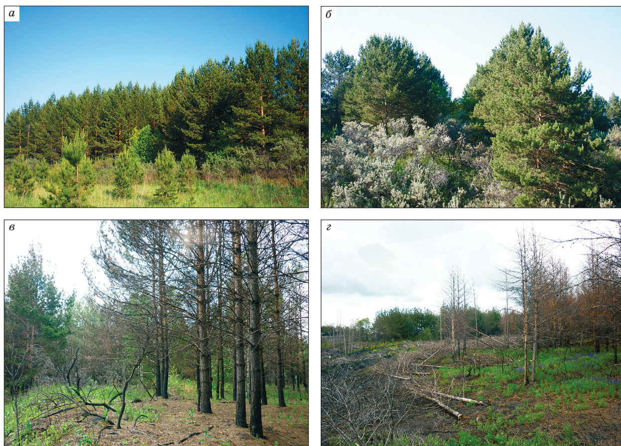
Рис. 1. Древесные культуры на отвалах Кузбасса (разрез Бунгурский): а – сосновый древостой Iа класса бонитета; б – совместные посадки сосны и облепихи; в – остатки облепихи и деградированный древостой сосны; г – погибшие культуры сосны на месте эндогенного пожара.