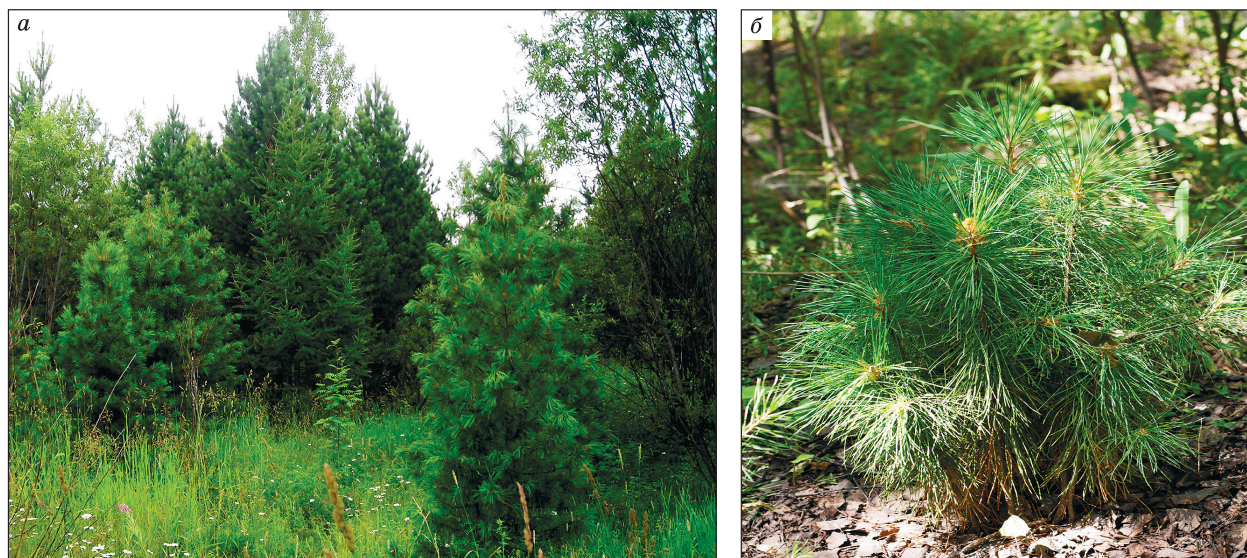
Рис. 4. Кедр сибирский на отвалах горно-таежной подзоны Кузбасса: а – в смешанных посадках с сосной обыкновенной и елью сибирской; б – самосев кедр под пологом березняков.

38-летние культуры лиственницы при густоте 0.32 тыс. шт./га произрастают по I классу бонитета, имеют высоту 12.8–14.5 м, средний диаметр 20–22 см, преобладают деревья I категории ОЖС (см. рис. 3, б) (Уфимцев, 2013). Под покровом лиственницы формируется мощная подстилка из опада хвои, благодаря высокой зольности которой в отличие от опада сосны обыкновенной создаются условия для развития дернового процесса и накопления гумуса. Лиственница предпочтительна для создания пожароустойчивой структуры насаждений, поскольку не только является огнестойкой древесной породой, но и формирует плотную подстилку, горение по которой распространяется очень медленно (Рекомендации..., 2005). Лист-